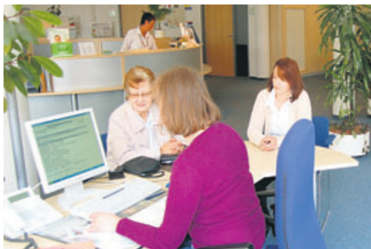
Das Bürgerbüro der Stadtverwaltung kommt in einer Befragung sehr gut weg. Die vereinzelt geäußerte konstruktive Kritik wird im Rathaus weitgehend umgesetzt.

Wer künftig zum Beispiel eine Geburtsurkunde benötigt, soll den Antrag dafür im Internetportal der Stadt ausfüllen und online „senden“ können. Sind die zehn Euro Gebühr per online-banking eingegangen,